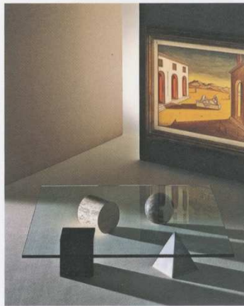
Tisch 'Metafora' in der Galleria del Naviglio vor De Chiricos Gemälde 'Piazza d' Italia'.

In der zweiten Hälfte des 20. Jahrhunderts erlangte das italienische Design weltweite Anerkennung. Maßgeblichen Anteil an diesem Erfolg hatten die Mailänder Fotografen Aldo Ballo und Marirosa Toscani Ballo. Die Fotografien der Ballos zeichnen sich durch die Konzentration auf die den Objekten eigenen Qualitäten aus und basieren auf präzisen, klaren Inszenierungen sowie einer sparsamen Auswahl an Requisiten. Sie entstanden für maßgebliche Hersteller wie Olivetti, Kartell oder Danese und für Zeitschriften wie Domus, Abitare und Casa Vogue. Neben den konzentrierten Objektportraits fotografierte das Paar aufwändig arrangierte Inszenierungen und Wohnungseinrichtungen sowie Persönlichkeiten der Mailänder Designszene. Bis heute werden diese Aufnahmen in allen wichtigen Publikationen über das italienische Design reproduziert, sie haben sich dem kollektiven Gedächtnis eingeschrieben und damit das Bild der Öffentlichkeit vom italienischen Design geprägt. Basierend auf dem Fundus der rund 146 000 Aufnahmen aus dem Studio Ballo, ergänzt um Bücher, Zeitschriften, Poster sowie 75 herausragende Objekte aus der Sammlung des VDM, zeichnet die Ausstellung 'Zoom' ein faszinierendes Bild der italienischen Designgeschichte seit 1953.